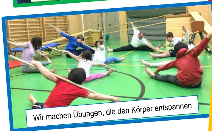
Wir machen Übungen, die den Körper entspannen