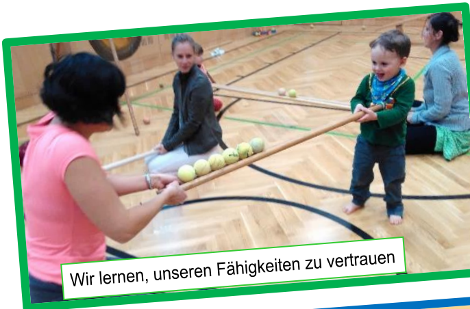
Wir lernen, unseren Fähigkeiten zu vertrauen

Schnuppern, Teilzahlung, Einstieg jederzeit möglich! (ab 3 Jahren)