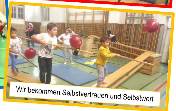
Wir bekommen Selbstvertrauen und Selbstwert

Ort: 1200 Wien, Turnsaal, ZIS - Zentrum für Inklusion und Sonderpädagogik, Treustraße 9