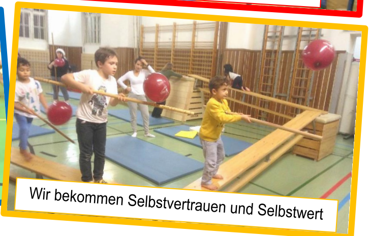
Wir bekommen Selbstvertrauen und Selbstwert

Ort: 1200 Wien, Turnsaal, ZIS - Zentrum für Inklusion und Sonderpädagogik, Treustraße 9