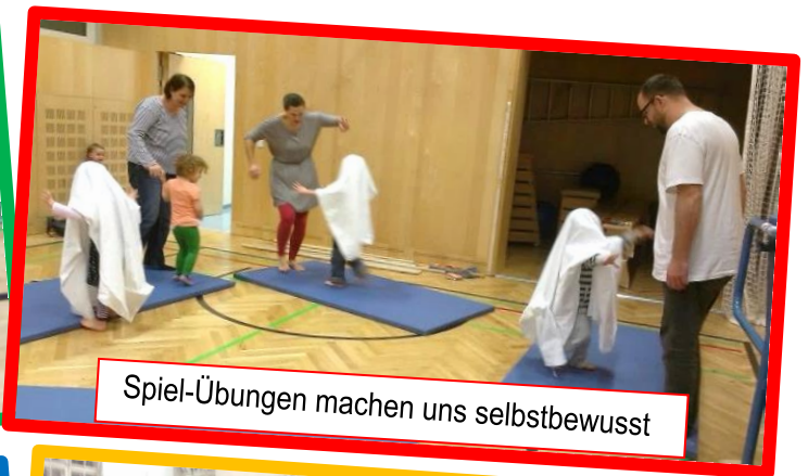
Spiel-Übungen machen uns selbstbewusst