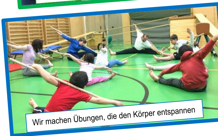
Wir machen Übungen, die den Körper entspannen