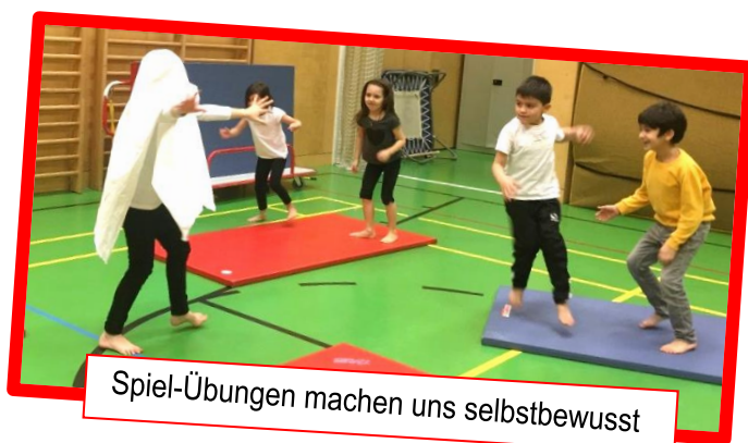
Spiel-Übungen machen uns selbstbewusst