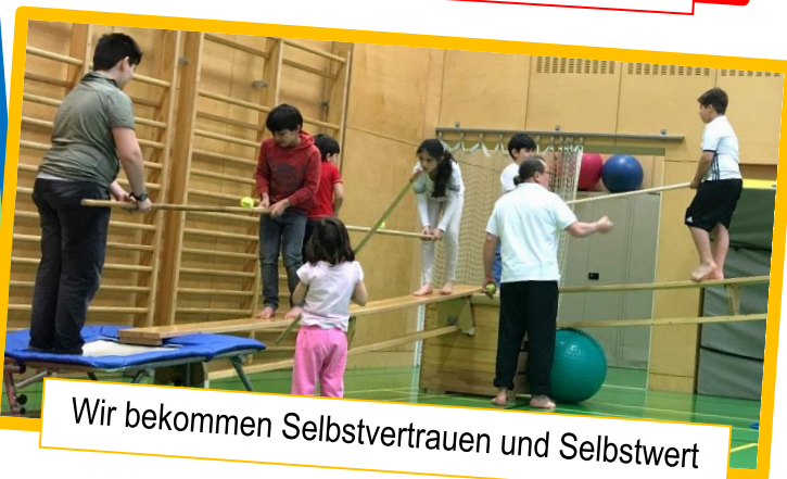
Wir bekommen Selbstvertrauen und Selbstwert

Ort: 1030 Wien, Turnsaal, GRG Radetzkystraße 2a Kurszeit: Montag, 16.00 – 18.00 Uhr Kursbeginn: Jänner 2023 Kurseinheiten: 10 x 2 Std Kurskosten: € 290,- pro Person (inkl. 20% USt)