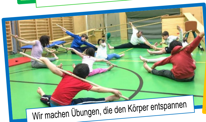
Wir machen Übungen, die den Körper entspannen