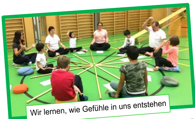
Wir lernen, wie Gefühle in uns entstehen

Herzliche Grüße Klaus Bierbaumer & das EuKiKoWa-Team