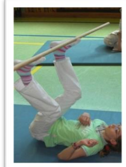
Koordinationsübungen mit dem Stab