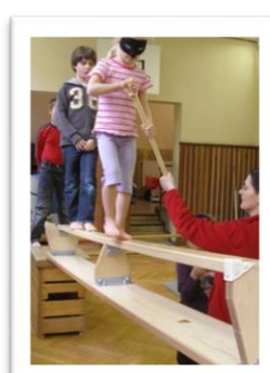
Blindparcours im Team